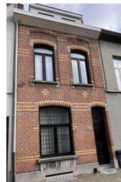
(Afbeelding: Beekstraat 32 Antwerpen)

Helaas werden de ogen van Leendert Pop na 1920 steeds slechter en hierdoor kon hij zijn werk als 'eigenwerkmaker' niet meer uitvoeren. Bij terugkeer uit Antwerpen trokken Leendert en zijn vrouw bij hun dochters in.