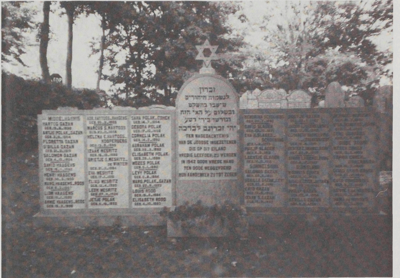
Monument op de Joodse Begraafplaats, Hoflaan te Middelharnis.