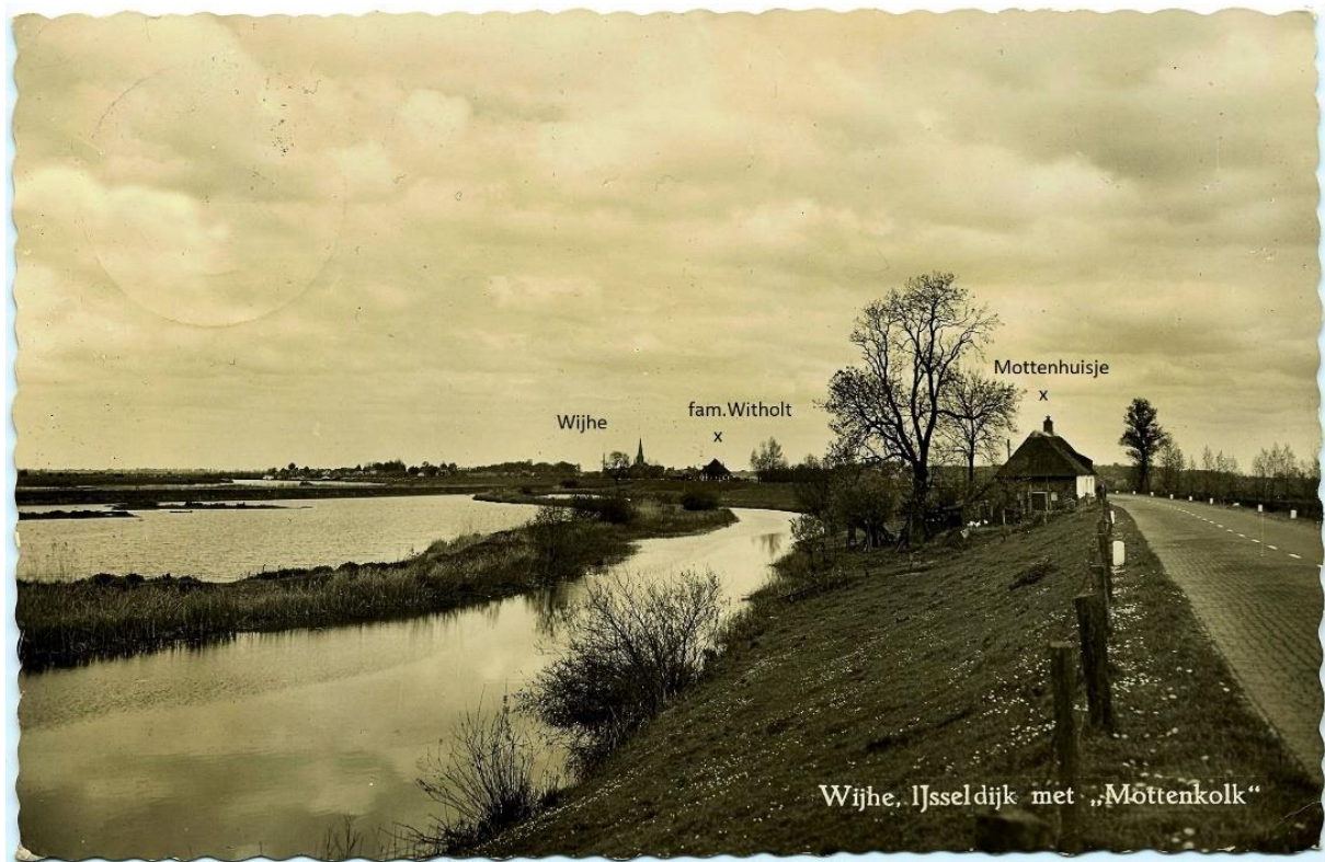
De plek des onheils tussen het "Mottenhuisje" en het huis van de fam. Witholt.

De gevolgen waren enorm, het was een der laatste transporten van Joodse gevangenen richting Westerbork. Bij die aanval zijn 7 hunner onmiddellijk dodelijk getroffen, 1 persoon Willy Polak geboren op 23-10-1915 overleed even later bij de fam. Witholt waar hij zwaar gewond naar binnen was gebracht. Hij werd later te Wijhe begraven en liet vrouw en een zontje van bijna 2 jaar achter; 2 maand later beviel zij nog van een dochter.