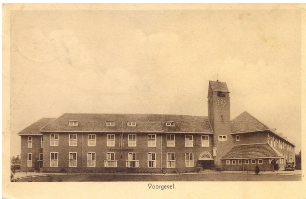
R.K. ziekenhuis Angeli Gustodes, Raalte.

Tussen de families Jansen, van Noorel en Sonépouse, zijn jarenlange vriendschapsbanden onderhouden, met bezoeken over en weer.