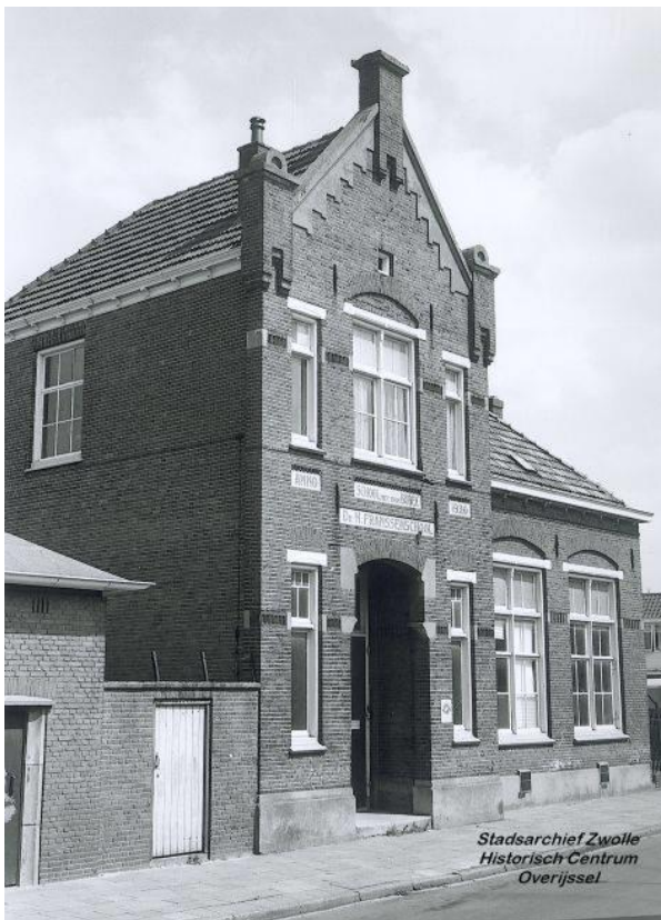
Noodziekenhuis in de Dr. Fransenschool te Zwolle (foto H.C.O. Zwolle)

Bewaard is gebleven, een brief van huisarts K. Ittmann, gestuurd aan mevr. Polak. (Historische Vereniging Wijhe)