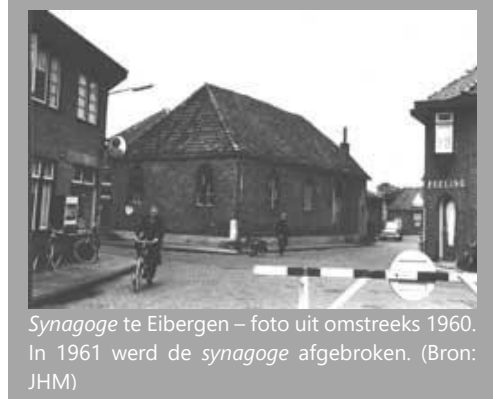
Synagoge te Eibergen – foto uit omstreeks 1960. In 1961 werd de synagoge afgebroken.