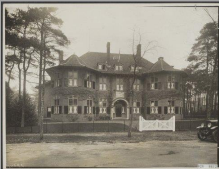
Villa Beth Azarja aan de Verdilaan 10-12 te Hilversum