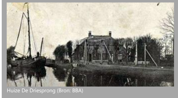
Huize De Driesprong