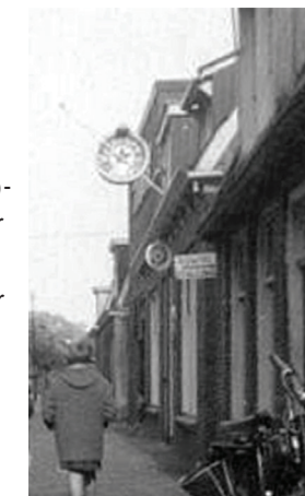
Café Van Leer in de Kerkstraat.