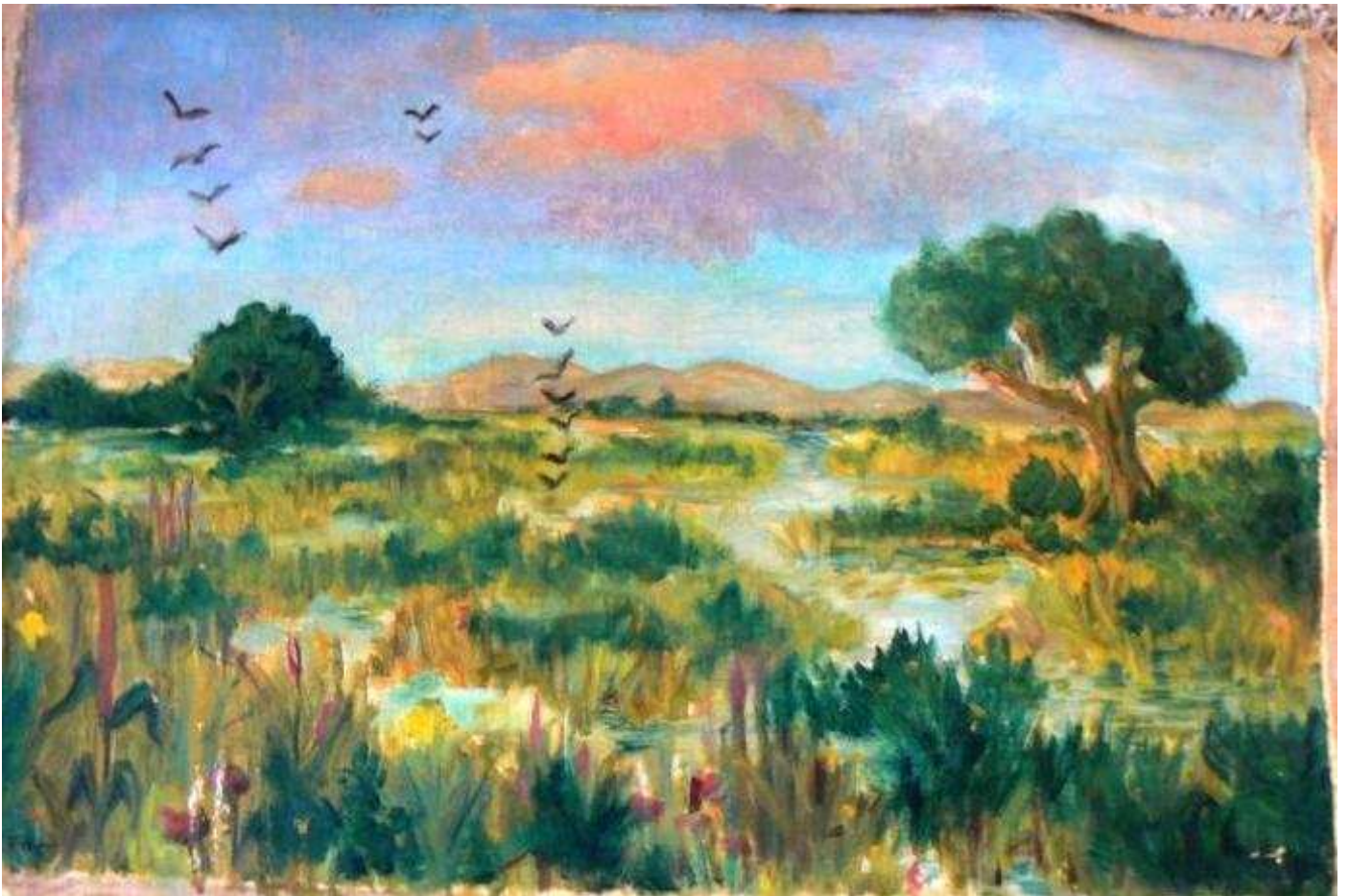
Landschap Indië (1936)