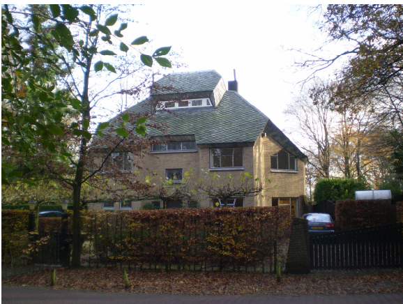
Raboes 21 Villa Gadalis