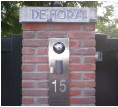
Laren, Raboes 15, De Horst