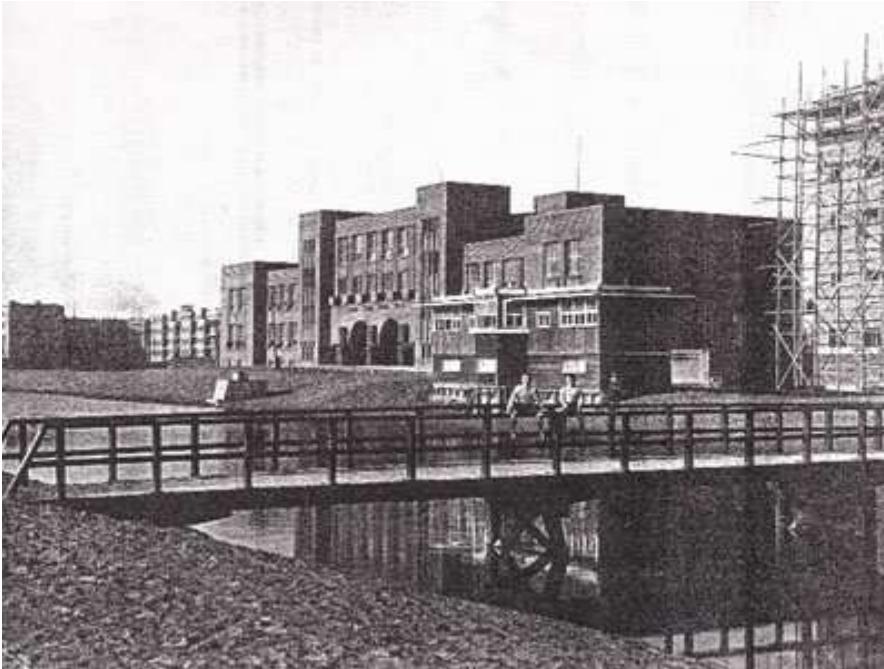
Het Amsterdams Lyceum vlak na de bouw. Het flatgebouw 'Westhove' is rechts nog in aanbouw. De brug over het Noorderamstelkanaal is er nog niet, er is slechts een tijdelijke houten loopbrug.