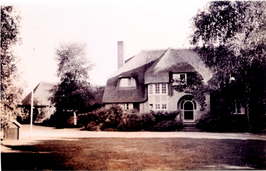
Raboes 15 Laren (foto 1937)