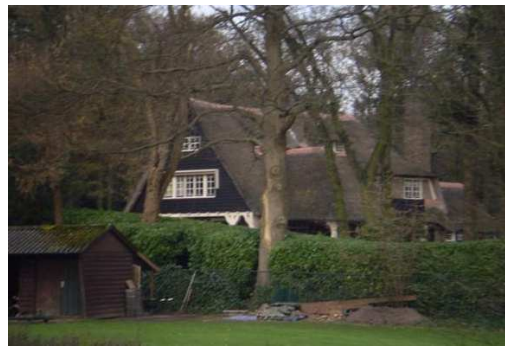
achterkant Raboes 15 (2011)