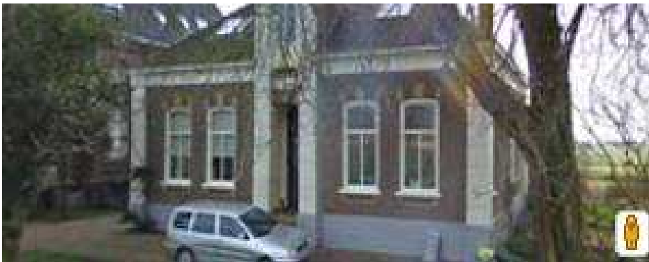
Pastorie Etersheim