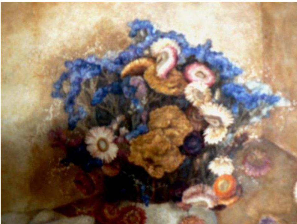
Boeket ( uitsnede)