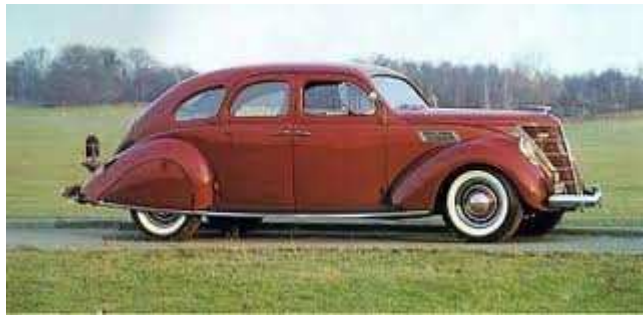
Ford Lincoln Zephir (bouwjaar 1936)