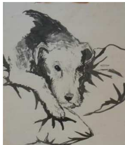
tekening Frans Hymans