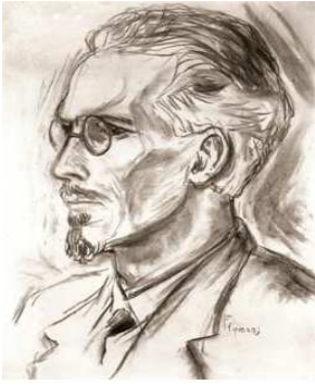
Door Frans getekend portret van zijn tekenleraar, 1934

De andere docenten hebben wat meer moeite met hem. Bij de overgang van de lagere school naar de middelbare wordt hij ziek en de eerste rapporten (december 1930) zijn zorgelijk: (cijfers op een schaal van 1 tot en met 4).