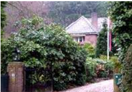
Raboes 12 (waar Ed Gerdes woonde)