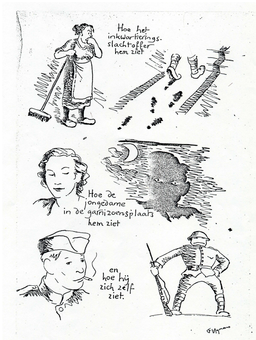
'De Soldaat', illustratie voor De Wacht.

Dit tijdschrift verscheen wekelijks van 18 november 1939 (mobilisatie) tot 11 mei 1940 (capitulatie). (26 nummers).