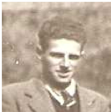
Eindexamen juli 1936