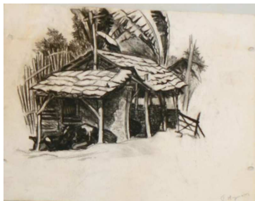
(tekeningen bij Juliana Hymans gefotografeerd in 2010 door Jan Snijders).